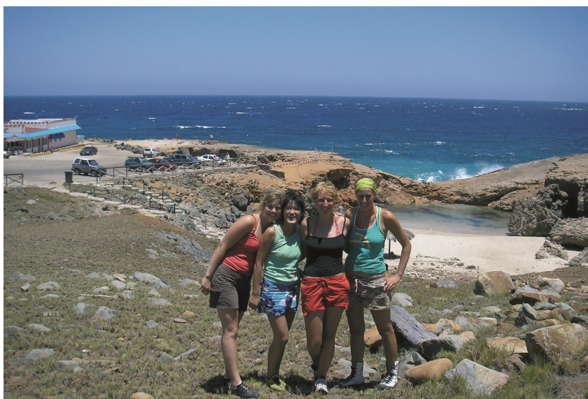
Vriendinnen op vakantie.